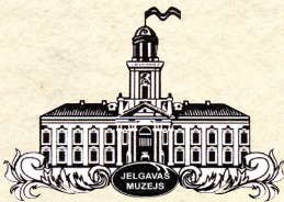
Viesītes novada dome